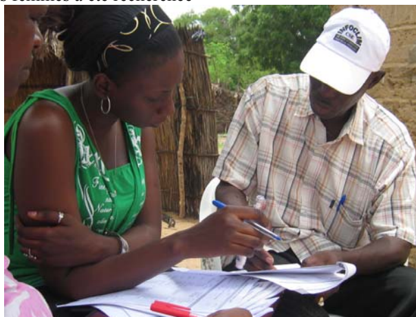
Le travail des enquêteurs contrôlé par les superviseurs