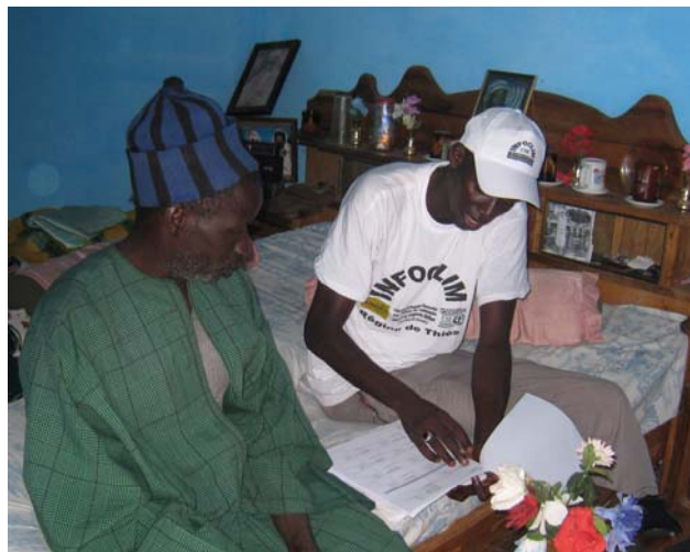
Enquêtes auprès des chefs d'exploitation