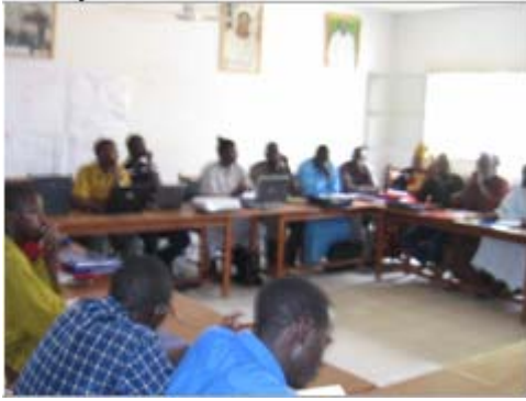
Une vue de la salle de formation