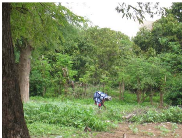
La perception des femmes a été recherchée